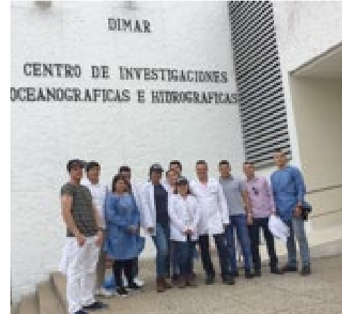
Foto: del grupo de estudiantes en las instalaciones de Dimar

En la tarde del día viernes 10 de mayo se visitó el Centro de Investigaciones Oceanográficas e Hidrográficas de la Dirección General Marítima DIMAR, en donde de manera muy cordial la visita fue recibida por el Director, se conocieron los laboratorios de Medio Ambiente, Pronóstico del Tiempo, Estudio de Suelos y Flora y Fauna.