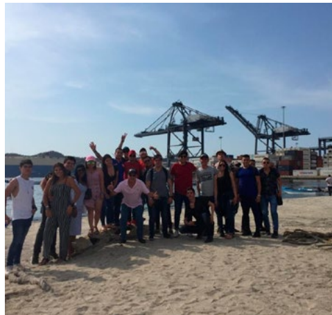
Foto del grupo de estudiantes en la Zona Portuaria de Santa Marta