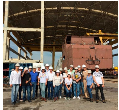
Foto del grupo de estudiantes en las instalaciones de la sala de capacitación y de producción de COTEMAR